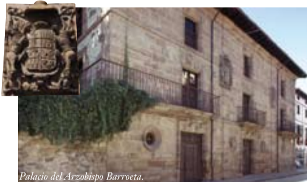
Palacio del Arzobispo Barroeta.

Ezcaray conserva un entramado de calles antiguas , con palacios y casa solariegas, con sus blasones, de los siglos XVII y XVIII. Los más importantes son el Palacio del Arzobispo Barroeta y el Palacio Ángel . Son clásicos caserones barrocos, de piedra de sillería (que en Ezcaray resulta siempre un poco rojiza) y puertas, ventanas y balcones adintelados. Además son característicos los canes tallados de los aleros de los tejados. Estos palacios dan fe de la importancia empresarial y económica que tuvo esta villa durante estos siglos.