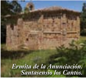
Ermita de la Anunciación. Santasensio los Cantos.

Se sitúa en el alto Oja, comprende otros términos más pequeños como Santasensio los Cantos , con su ermita románica, Tondeluna , Amunartia , Arviza , Ulizarna , Uyarra ... Sus primeros registros escritos se remontan al 939 aunque se cree que está zona estaba poblada desde la edad de hierro o incluso antes, debido a los vestigios encontrados. El escudo de Ojacastro representa 12 aldeas, aunque hoy en día no son tantas. Merece la pena visitar su iglesia y fijarse especialmente en la pila bautismal románica y en la ventana del mismo estilo que aún se conserva.