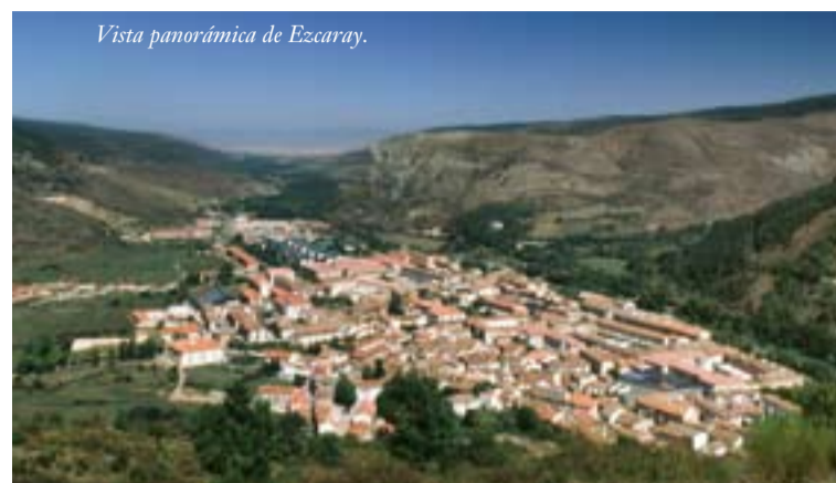
Vista panorámica de Ezcaray.

Fecha clave para la villa fue el 24 de abril de 1312 , cuando, estando celebrando Cortes en Valladolid, el rey Fernando IV el Emplazado, otorgó Fuero al Valle de Ezcaray, Ojacastro, Zorraquín y Valgañón . Por este Fuero los habitantes del valle quedaban libres de todo pecho, tributo y empréstito, excepto cinco maravedíes por cada vecino al rey. Asimismo les eximia de pagar portazgo de sus ganados, mercaderías, etc..., excepto en las ciudades de Toledo, Murcia y Sevilla. Además, otro de los privilegios de este Fuero era el de permitir refugio y defensa de los malhechores que llegaran a este valle, con el fin de favorecer la repoblación del mismo; nadie podía venir de fuera a juzgarlos, Ezcaray tenía su propio Fuero y justicia para poder hacerlo.