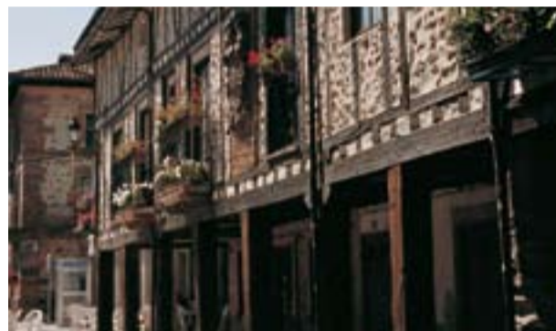
Rincón típico con soportales.

El Fuero fue confirmado por el rey Alfonso XI y su esposa la reina Constanza el 14 de abril de 1326, y por los Reyes Católicos el 26 de noviembre de 1484, pero anulando lo concerniente al acogimiento de delincuentes y deudores. En el texto de la enmienda se denomina oficialmente al territorio: " Valdezcaray ". Por último el rey Fernando VII confirmó el Fuero en Madrid, el 13 de diciembre de 1814. En la plaza de la Verdura, se conserva " La Argolla del Fuero ", símbolo del pasado de la villa.