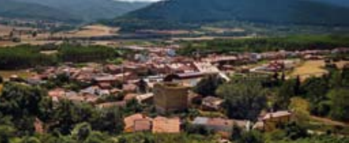
Vista panorámica de Santurde.

Existen otros senderos en la localidad, más ligeros y de menor recorrido. Los más habituales son el paseo hasta la ermita de Santa Bárbara y el paseo del río Oja .