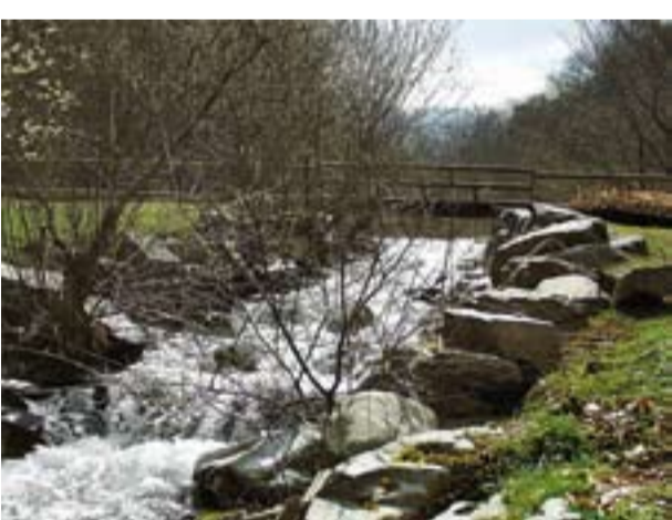
Área recreativa de El Llano de la Casa

Las áreas recreativas son zonas que destacan por su belleza en un entorno natural, y que cuentan con las infraestructuras necesarias para su uso y disfrute. Son varias las áreas recreativas que se encuentran en el Valle del Oja, y La Sierra de la Demanda.