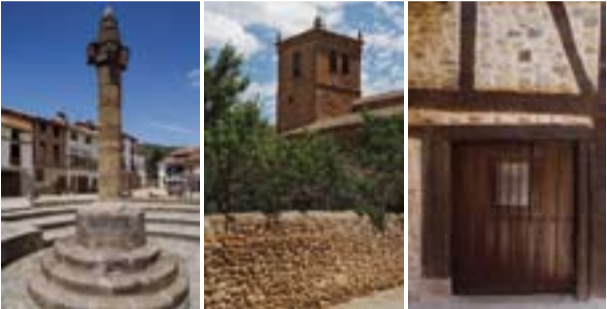
Ojacastro. Plaza Mayor. Iglesia de San Julián y arquitectura popular.