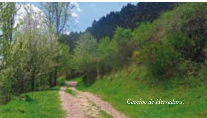
Camino de Herradura.

Usuarios: A pie, a caballo, en bici y accesible para discapacitados.