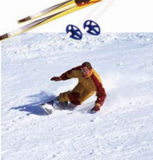
Snowboard en Valdezcaray.

Recientemente se han remodelado todas las instalaciones de la estación, adecuándola a las necesidades de una estación de esquí moderna y funcional. Se han creado nuevas pistas, se han arreglado las antiguas, se han instalado cañones de nieve, remontes, telesillas, aparcamiento y nuevos edificios que hacen de esta estación una de las más completas del norte del país.