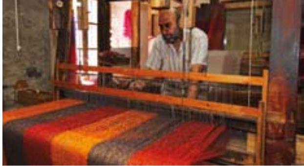
Fabricación en telar de una manta tradicional de Ezcaray.

Además trabajan en esta villa artesanos que se dedican al mueble tradicional, tallas de madera, cantería de piedra,etc.