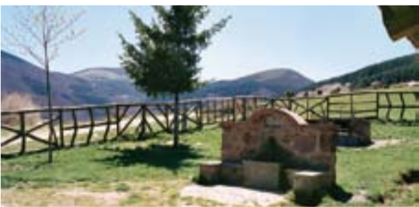
Área recreativa de Bonicaparra.

Este paseo se sitúa entre Ezcaray y Posadas con una longitud total de 10 Km. Sale del sur de Ezcaray, junto al Puente Canto y por la margen izquierda del Oja. Comenzamos el camino en dirección al Campamento del Molino Viejo, y pasamos por la Fuente del Perico. Desde aquí comienza la ligera ascensión, siempre rodeados de vegetación. En este paseo encontraremos bosques mixtos , chopos y avellanos en las orillas del Río Oja, además de hayas y pinos en la zona de monte. Cruzaremos además varios arroyos, y ya en la aldea de San Antón nos encontramos a 900 metros de altitud. A partir de aquí, y a unos 3 Km.. del final del paseo el valle se estrecha, para llegar a la aldea de Posadas , donde termina nuestro recorrido.