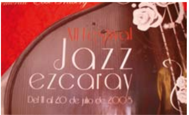
Cartel del Festival de Jazz

Un buen momento para acercarse a Ezcaray si le gusta el jazz es durante la primera quincena de julio , cuando se celebra en la villa el festival que cuenta ya con más de doce ediciones. Además del prestigio de las actuaciones, resulta especialmente atractivos los lugares en los que se celebran y los “maridajes” con la gastronomía con que cuentan estos conciertos. Las noches de verano bien sean en un restaurante o al aire libre escuchando jazz son una delicia en esta villa serrana. La iniciativa paralela “Pinchos y Jazz” ofrece la posibilidad de probar las exquisitas tapas que preparan los numerosos establecimientos de Ezcaray, acompañadas de un Rioja.